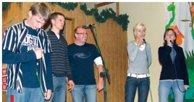
Attonare w czasie próby. W ubiegłym roku grupa zdobyła I nagrodę w Przeglądzie Piosenki Religijnej w Komprachcicach

Kolejne jesienne spotkanie członków Papieskich Dzieł Misyjnych oraz sympatyków misji odbędzie się 24 października w Nysie, w bazylice św. Jakuba. Początek spotkania o godz. 10.00, zakończenie ok. 13.30.