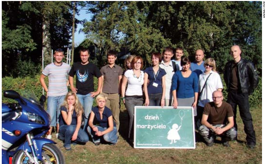
Wolontariusze i sympatycy opolskiego oddziału Fundacji „Mam marzenie”

Opolski oddział fundacji, który powstał w sierpniu 2007 r., skupia kilkunastu wolontariuszy. – Jedni