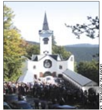
Sanktuarium Maria Hilf