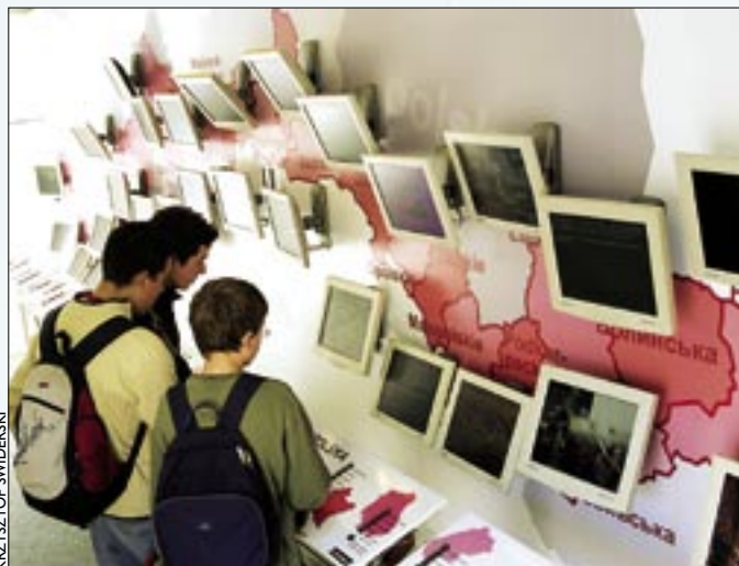
Młodzi opolanie oglądają multimedialną prezentację

OPOLE. Przez dwa dni opolanie oglądali multimedialną prezentację „Via Regia” na 28 monitorach w kontenerze na opolskim rynku. Ekspozycja poświęcona była najstarszemu i najdłuższemu traktowi łączącemu wschodnią i zachodnią Europę, który biegł przez Hiszpanię, Francję, Niemcy, Polskę na Ukrainę. Nie stracił do dziś swego znaczenia, od-