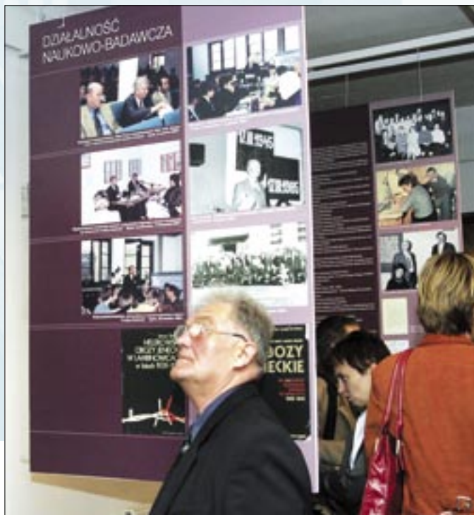
Na zdjęciu fragment ekspozycji

które działały tam od początku wojny francusko-pruskiej. Szczególną uwagę zwraca się jednak na lata 1939–1945, gdy naziści zorganizowali obozy, przez które przewinęło się ponad 300 tysięcy jeńców różnej narodowości. Po wojnie przez blisko dwa lata osadzani tam byli również Ślązacy.