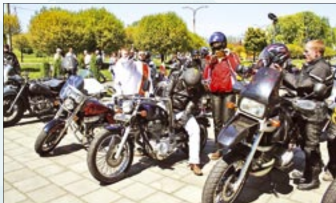
Wszystkie motocykle zostały poświęcone